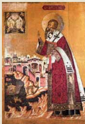
Святой Климент Римский