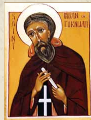
Святой Пиран Корнуоллский

Ряд православных святых занимались подземным строительством обустривая «пещерные» храмы, монастыри и кельи включая: основателя отшельнического монашества Антония Великого, основателей Киево-Печерской лавры Антония, Феодосия и Варлаама, основателя Вознесенского Печерского монастыря Дионисия, первого этнически русского митрополита Иллариона, основателя Фаранской лавры (Эйн Фара) преподобного Харитона, создателя Иерусалимского устава и основателя известной палестинской лавры – Савва Освященного, а также ряд других святых. Огромное количество святых связанных с горным ремеслом не позволяет привести детальную информацию по каждому из них.