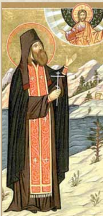
Святой мученик Ювеналий