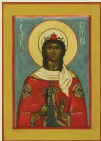
Святая Варвара Илипольская

В традиции католической церкви уже стало традицией закреплять за определенными святыми патронаж над той или иной профессией или областью деятельности. В православии это менее развито, хотя и не противоречит его учению.