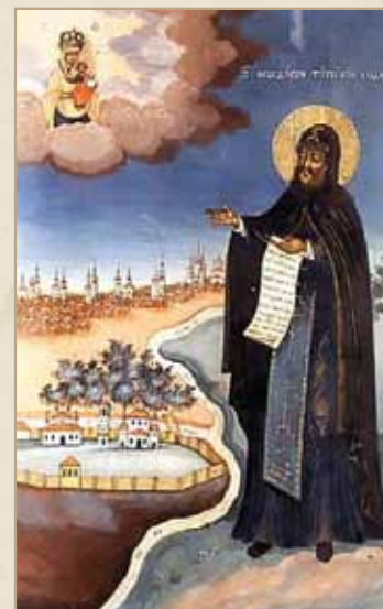
Святой преподобный Феодосий Тотемский

Память святого совершается 10 февраля (28 января по старому стилю).