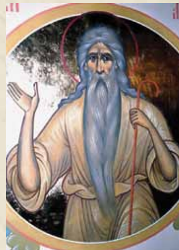
Макарий Великий (Египетский)

В православной церкви память святого совершается 12 ноября (25 ноября по старому стилю).