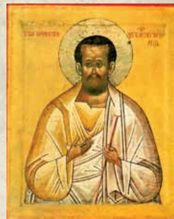
Святой Христа ради Юродивый Прокопий Устюжский

Память Святого совершается 21 июля по новому стилю (8 июля по старому стилю).